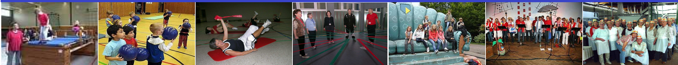
Sportangebote vom Eltern/Kind-Turnen über das Kinderturnen und Fitnessstraining bis zum Hochaltrigen Sport