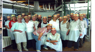
Freizeitaktivitäten außerhalb des Sportbetriebs