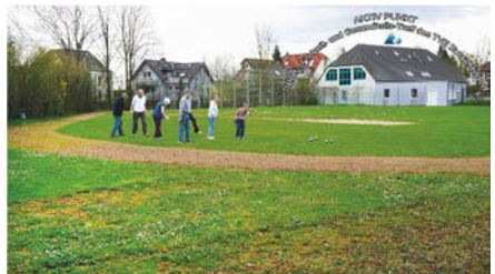
Fotomontage .d. zukünftigen Bouleplatzes

Ab dem 17.05. bis zum 30.06. wird nun über alle eingereichten Bewerbungen abgestimmt: Dem Vernehmen nach haben sich 400 Organisationen um die 175 Prämien geworben.