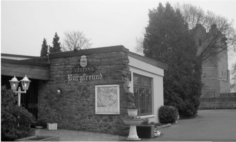
Café – Restaurant “Burgfreund“ Burgstraße 2, 45289 Essen (Burgaltendorf) Tel. : 0201 / 578935